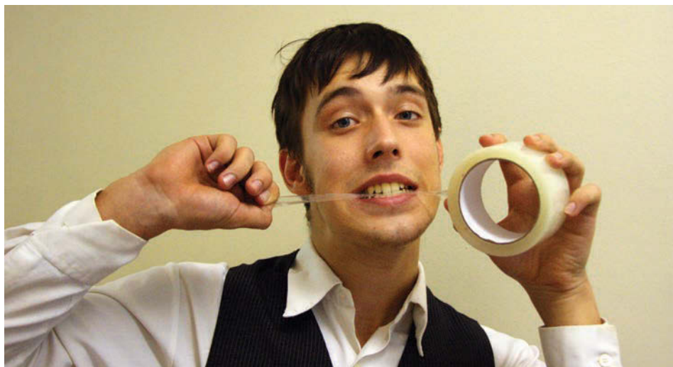
На этой фотографии показано, как правильно кусать скотч